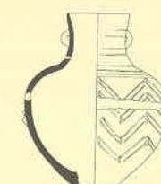
kultura zvoncovitých pohárů