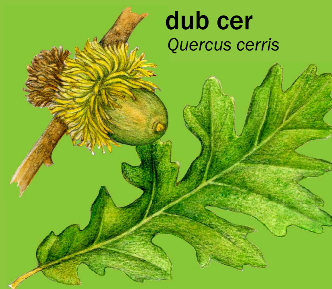
dub cer Quercus cerris

Kromě dubu letního můžete potkat u rybníků také dub cer, jehož žaludy mají střapatou číšku.