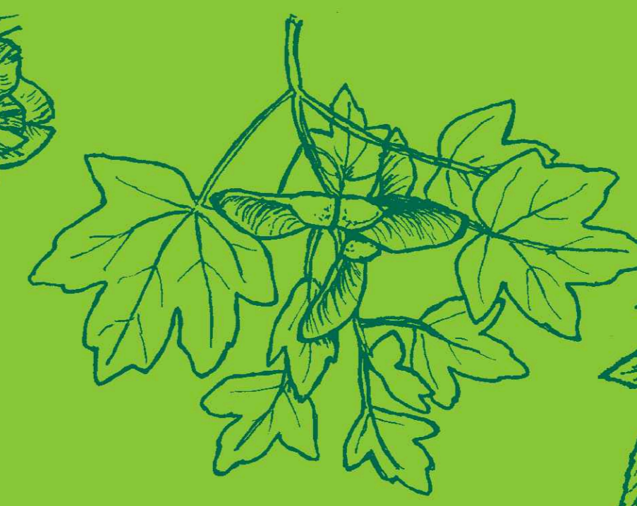
javor babyka Acer campestre