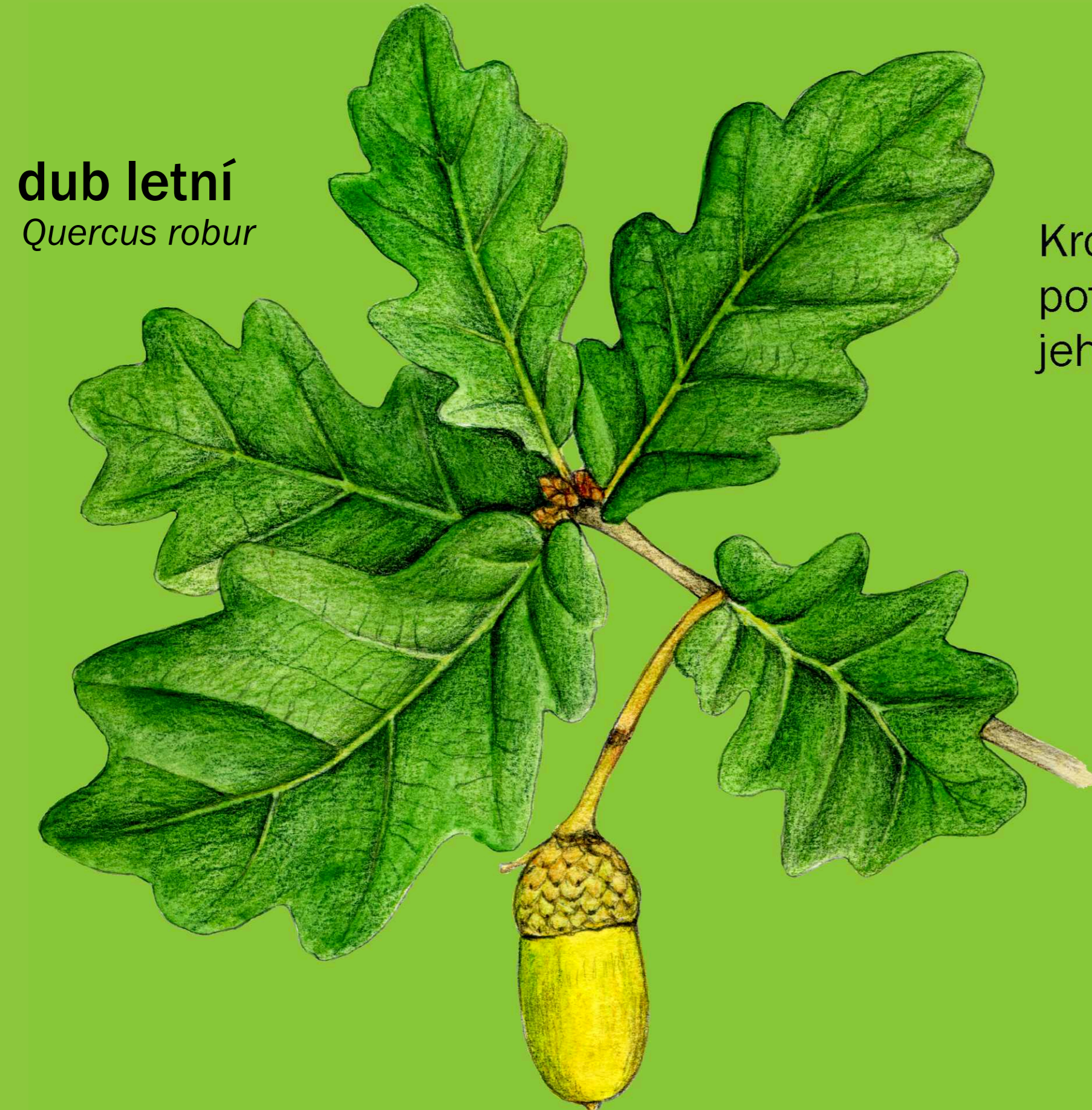
dub letní Quercus robur

Přímo u vody roste nejčastěji olše lepkavá a vrby, v břehových porostech pak také jasany úzkolisté, babyky a jilmy.