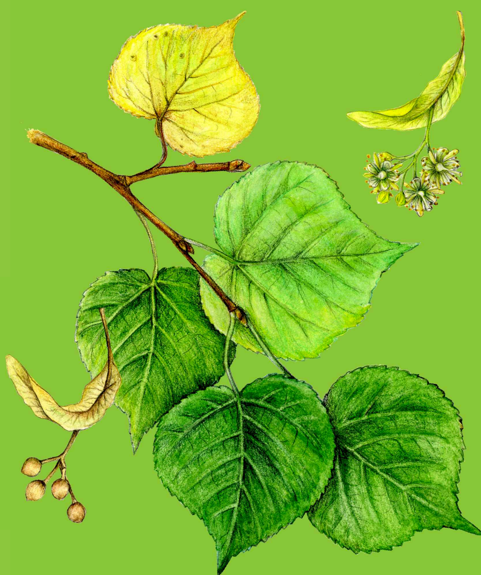
lípa srdčitá Tilia cordata

Lípy jsou jednou z hlavních dřevin zdejších břehových porostů. Společně s jírovcem maďalem tvoří také Bezručovu alej.