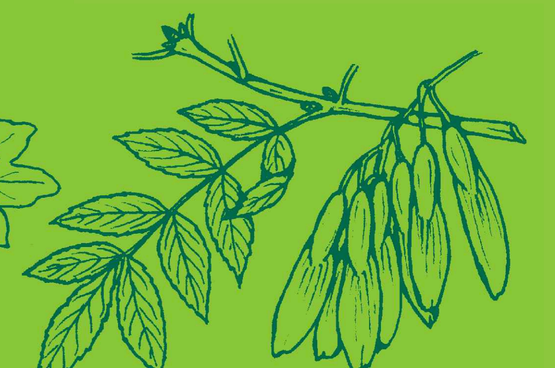
jasan úzkolistý Fraxinus angustifolia