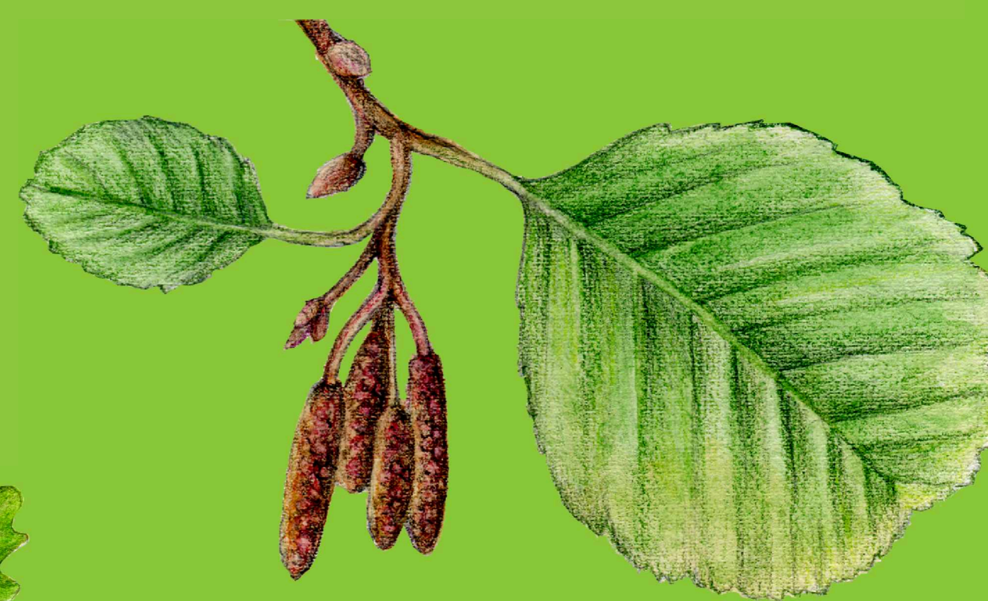
olše lepkavá Alnus glutinosa