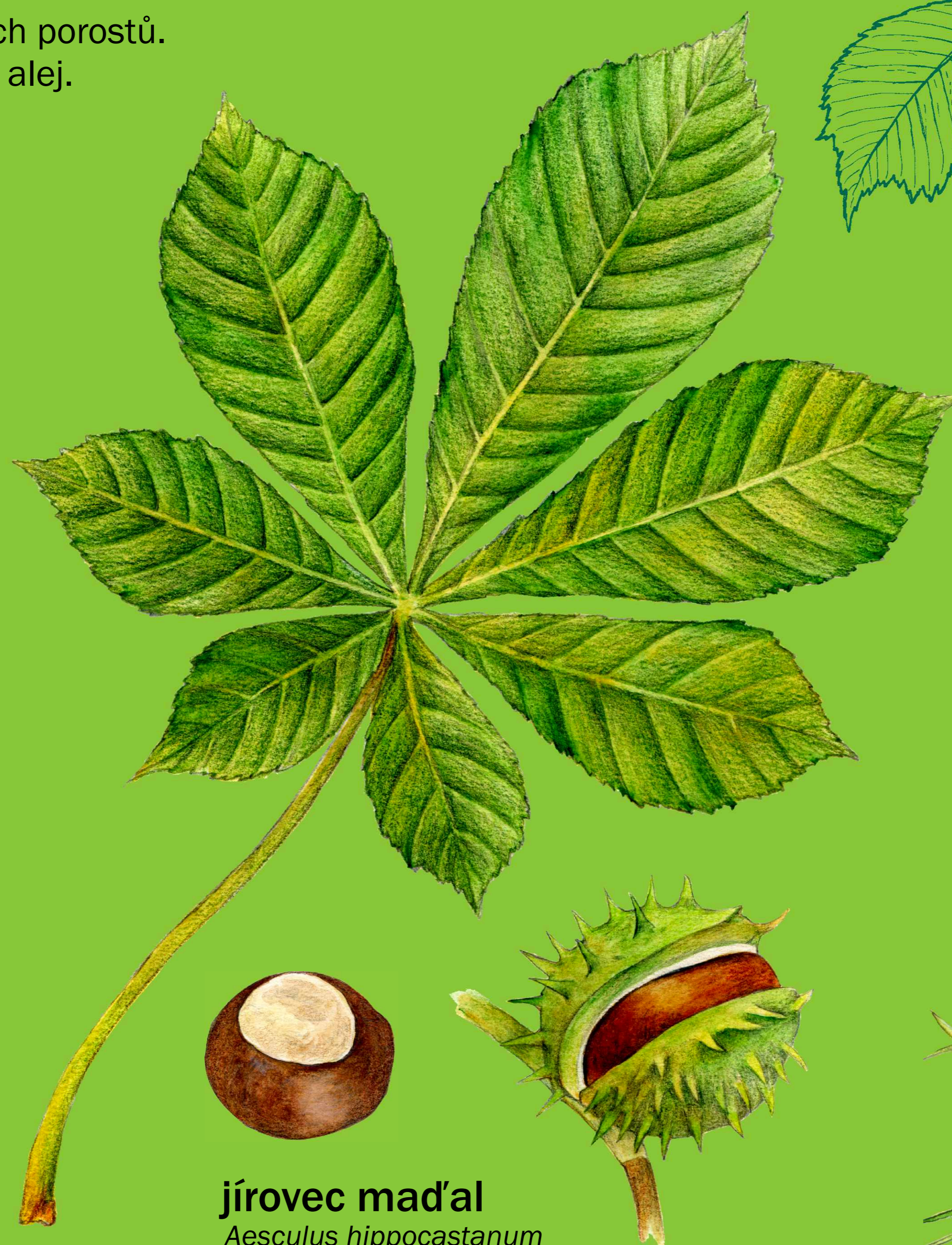
jírovec maďal Aesculus hippocastanum