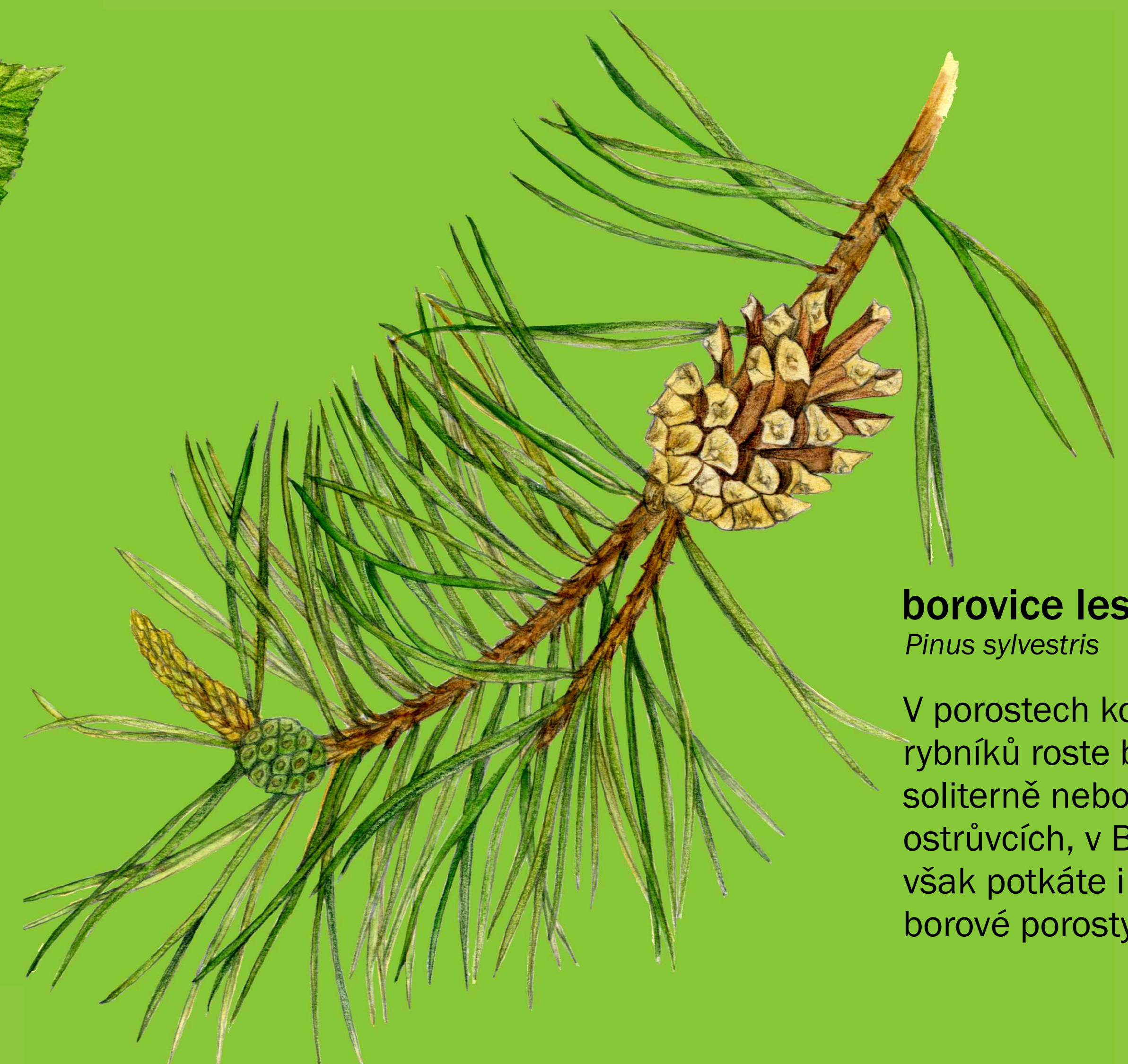
borovice lesní Pinus sylvestris

V porostech kolem rybníků roste borovice soliterně nebo v malých ostrůvcích, v Bořím lese však potkáte i rozsáhlé borové porosty.